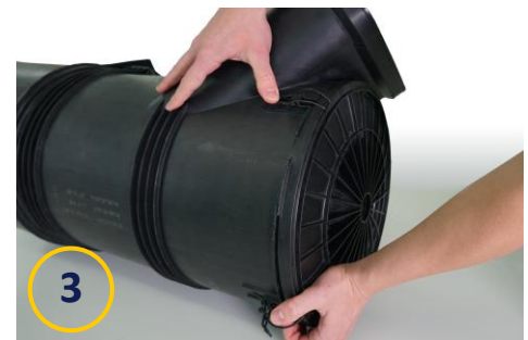
E1572L von Hengst mit MAN-Luftfiltergehäuse