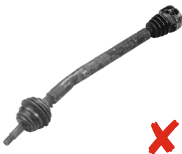
Il semiasse è completo ma piegato.