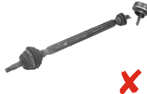
Il semiasse è incompleto: un giunto si è staccato