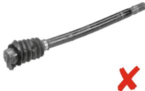
Il semiasse è incompleto: manca un giunto.