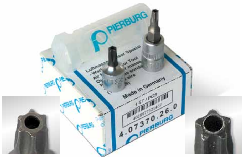
Einsatz T 20 (6-Stern, Torx®) mit Stirnlochbohrung

Es handelt sich bei den beiden Werkzeugen um 1/4-Zoll-Einsätze in bewährter MSI-Qualität, passend zu allen handelsüblichen 1/4-Zoll-Knarren oder -Steckschlüsseln.